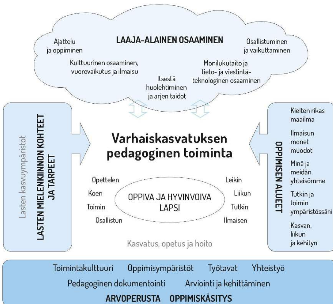
Kuvio 1. Varhaiskasvatuksen pedagogisen toiminnan viitekehys

Varhaiskasvatuksen pedagogista toimintaa ja sen toteuttamista kuvaa kokonaisvaltaisuus. Tavoitteena on edistää lasten oppimista ja hyvinvointia sekä laaja-alaista osaamista (kuvio 1). Pedagoginen toiminta toteutuu lasten ja henkilöstön välisessä vuorovaikutuksessa ja yhteisessä toiminnassa. Lasten omaehtoinen, henkilöstön ja lasten yhdessä ideoima sekä henkilöstön johdolla suunniteltu toiminta täydentävät toisiaan. Varhaiskasvatuksen pedagoginen toiminta läpäisee kasvatuksen, opetuksen ja hoidon kokonaisuuden.