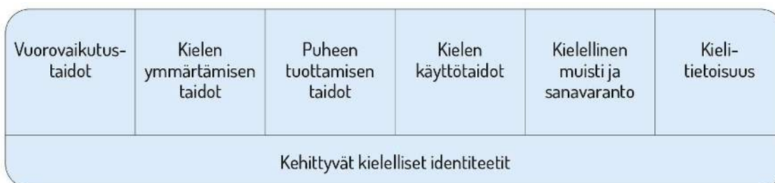
Kuvio 2. Lasten kielen kehityksen keskeiset osa-alueet varhaiskasvatuksessa

Kielen oppimisen kannalta on tärkeää tiedostaa, että samanikäiset lapset voivat olla eri vaiheissa kielen kehityksen eri osa-alueilla. Kielelliset identiteetit kehittyvät , kun lapsia ohjataan ja tuetaan kielellisten taitojen ja valmiuksien keskeisillä osa-alueilla.