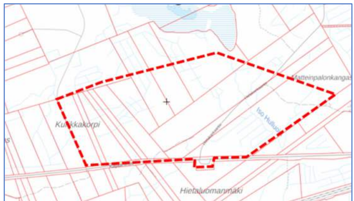
Kuva 2. Suunnittelualueen alustava rajaus. Rajaus voi tarkentua kaavasunnittelun aikana.

Osayleiskaava hyväksytään kaupunginvaltuustossa alueidenkäyttölain mukaisena oikeusvaikutteisena yleiskaavana, joka sitoo maanomistajia ja viranomaisia. Rakentamislupaa myönnettäessä on katsottava, että alueen käyttöä yleiskaavassa varattuun tarkoitukseen ei vaaranneta. Myöskään viranomaistoimienpiteillä ei saa vaikeuttaa yleiskaavan toteuttamista.